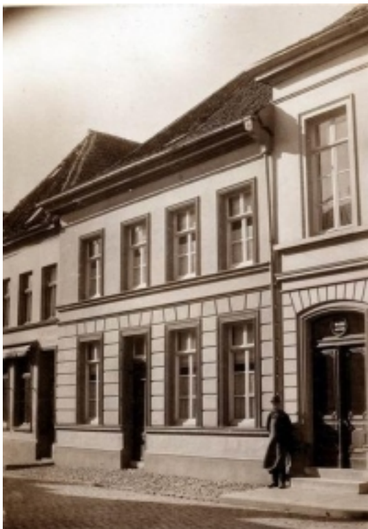
Rodný dom Arnolda Janssena

vzbudilo v ňom záujem o svetové misie Cirkvi. Preto sa rozhodol zasvätiť celý svoj život prebúdzaniu misijného povedomia v Nemecku. To ho viedlo k tomu, že sa r. 1873 zriekol svojej učiteľskej činnosti a čoskoro nato začal vydávať časopis s názvom „Malý posol Božského Srdca“. V tomto ľudovom mesačníku uverejňoval správy z misií a povzbudzoval katolíkov v nemecky hovoriacich krajinách, aby sa vo väčšej miere zasadzovali za misie a ich potreby.